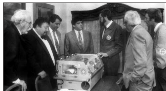
Szállítóinkubátor átadása a vásárhelyi Kórháznak