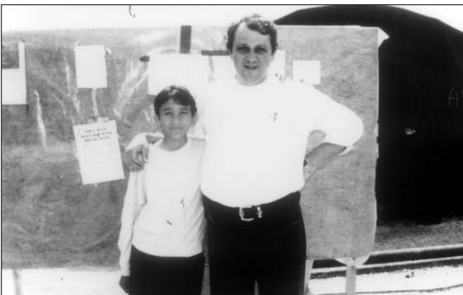
Gyógyult albán gyermekekkel a Tetovo-i menekülttáborban