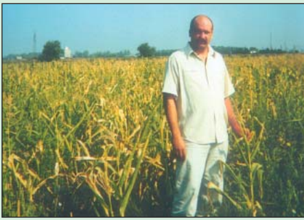
Jellemzően aszálysújtotta tábla

– Ebben a gazdasági évben is – mint már annyiszor e régióban – a gazdálkodók legeslegnagyobb problémája a csapadékhiány, az aszály, ami miatt sajnos számukra ez az év is veszteséges lesz, vagy legjobb esetben is csak a befektetések térülhetnek vissza.