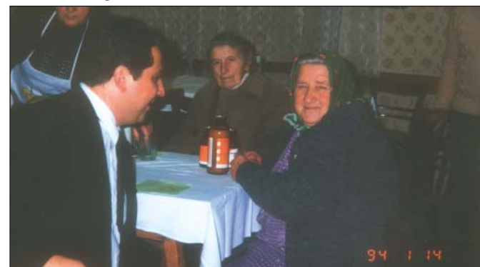
Nyugdíjasok köszöntése a Szerencse utcai olvasóköri