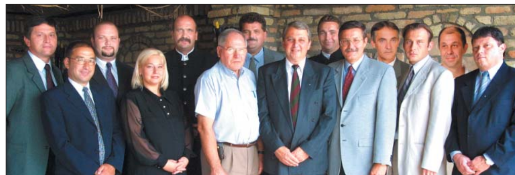
A Tiszta Lap Egyesület jelöltjei