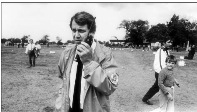
Horthy Miklós kenderesi újratemetésén, mint az egészségügyi ellátás parancsnoka

A gulágok E-322-es rabja Budapest, 2002. augusztus 25.