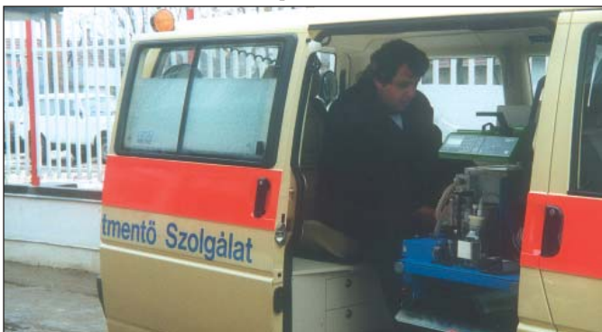
Az Újszülött Életmentő Szolgálat mentőautója, az első „mozgó intenzív osztály” Dél-Magyarországon